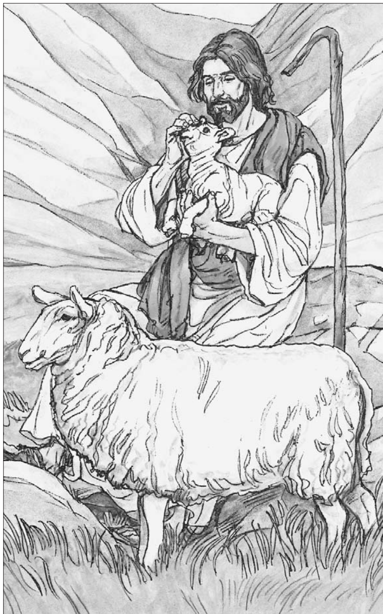
Jesús es nuestro Buen Pastor.