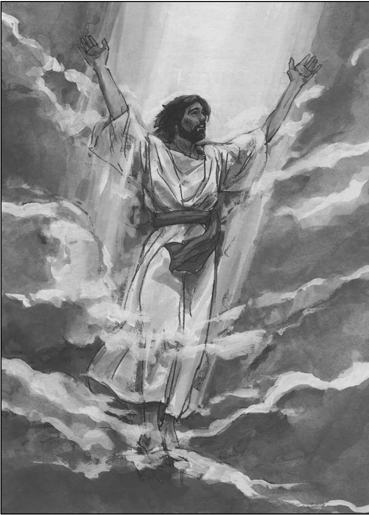
耶稣从死里复活和升天