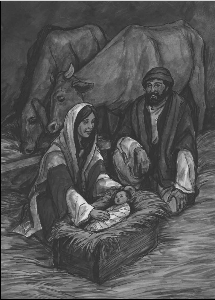
玛利亚给婴孩耶稣包裹衣服，把他安睡在马槽里。