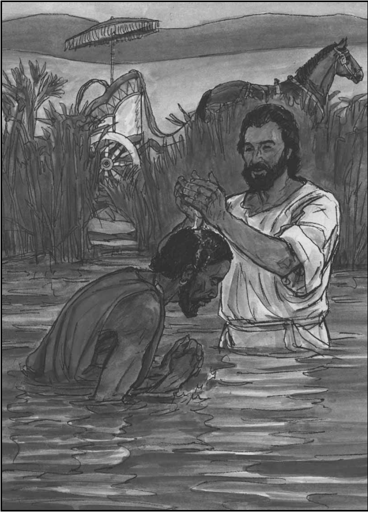
腓力为从艾撒厄比亚来的人施洗。